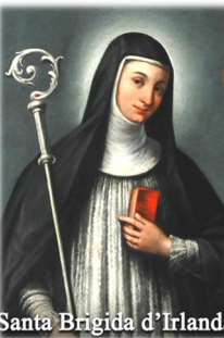
Santa Brigida d'Irlanda