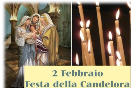
2 Febbraio Festa della Candelora