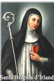
Santa Brigida d'Irlanda