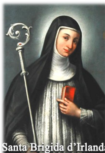
Santa Brigida d'Irlanda