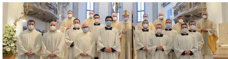
nella foto: la comunità del SEMINARIO con il Vescovo ed educatori

Siamo chiamati alla preghiera in questa domenica per chiedere al Signore il dono di sante e "tante" vocazioni alla vita sacerdotale e religiosa... preghiamo davvero Gesù: "Manda Signore, operai nella tua messe!". I giovani che studiano nel nostro Seminario Diocesano sono 17, non sono tanti, ma possiamo sostenere parte delle spese dei loro studi con il nostro contributo economico. In questa Domenica 02 ottobre ci sarà la raccolta di offerte pro-seminario nelle nostre tre comunità.