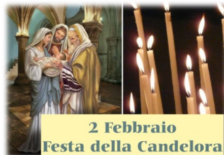
2 Febbraio Festa della Candelora

Maria . Le celebrazioni del "LUCERNARIO" con la Benedizione delle candele saranno alle ore 9.15 a Liedolo alle ore 10.30 a Semonzo e alle ore 18.30 a S. Eulalia e all'inizio della celebrazione delle altre SS. Messe ci sarà sempre la benedizione delle candele.